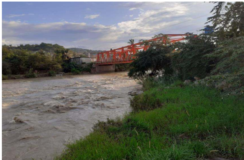
FIGURA N°01: : TRAMO CRÍTICO EN EL PUENTE CAJARURO PRESENTADO EROSION EN LA MARGEN IZQUIERDA DEL RIO UTCUBAMBA EN EL SECTOR PUENTE CAJARURO, DISTRITO DE BAGUA GRANDE, PROVINCIA UTCUBAMBA- AMAZONAS.